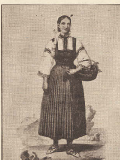
Olovanca bira Zadra (1846. godina)