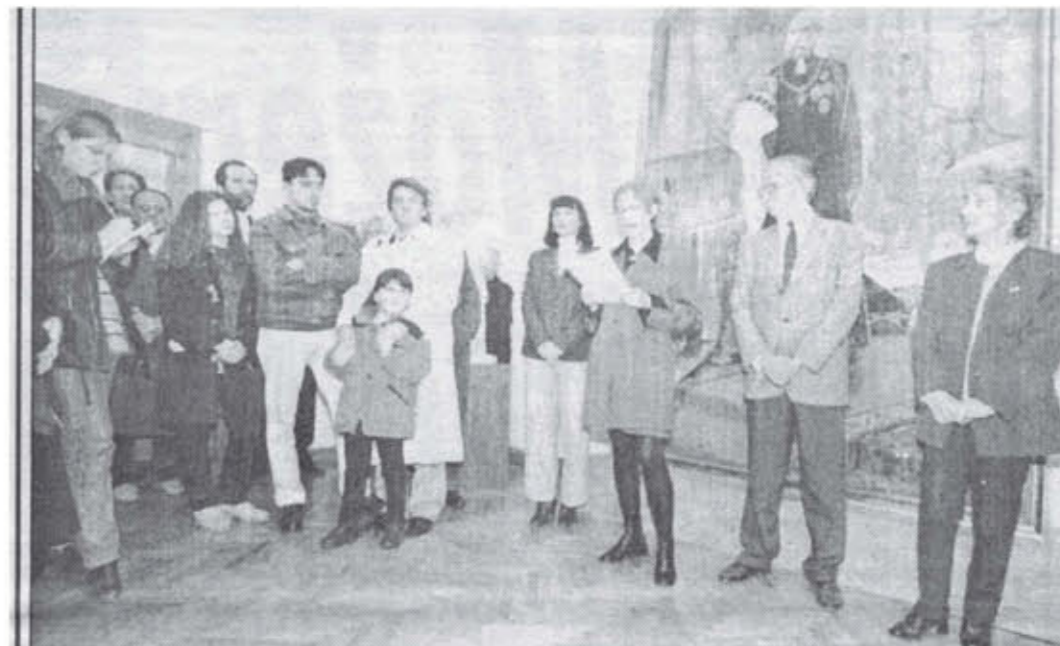
Prizor s otvorenja stalnog postava u zadarskoj Galeriji umjetnina.

Prezentacija Galerijeskog fundusa na žalost nije bila konstantna te se postav često spremio u čuvaonice da bi se ustupio prostor za potrebe održavanja Čovjeka i mora, Plavog salona te retrospektivnih i drugih većih izložbi. Tako je postav doživio nekoliko tematskih izdanja tijekom postojanja Galerije, a zadnjom verzijom pod nazivom Hrvatsko slikarstvo i kiparstvo XIX. i XX. stoljeća simbolično je obilježen kraj opsade grada nakon Domovinskog rata kada je Galerija nakon osam godina ponovno otvorila svoja vrata izborom 97 djela iz svojeg fundusa.