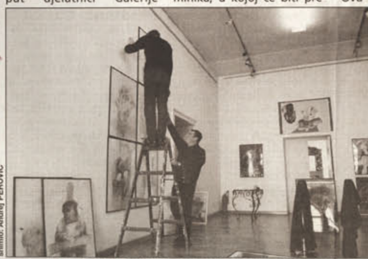
Radovi Nives Kavurić Kurtović već su dopremljeni u Zadar (u Galeriju umjetnina)

U izložbi su predstavljena djela nastala od 1962. do 2003. godine. Umjetnica je predstavila 150 radova, uključujući slike, crteže, gravure i skulpture. Retrospektiva sadrži radove nastale u vremenskom rasponu od 1962. do 2003. godine. Umjetnica je predstavila 150 radova, uključujući slike, crteže, gravure i skulpture.