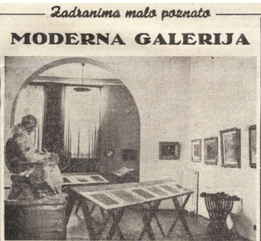
Zadranima mala poznata MODERNA GALERIJA

Jedan od prvih članaka u tisku koji spominje otvorenje Galerije u poslijeratnom valu obnova i otvaranja kulturno-obrazovnih institucija.