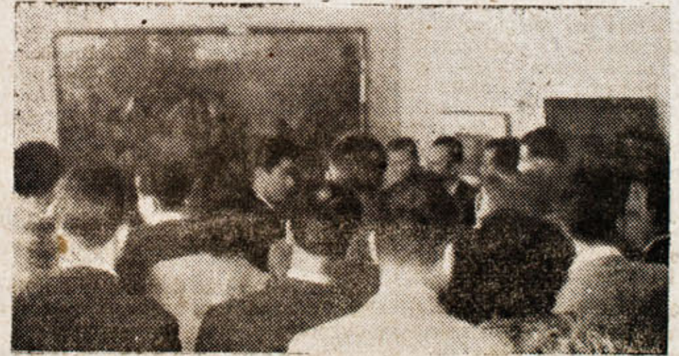
Sa otvorenja Galerije umjetnina u Zadru

ekonomskim životom i sve prosvjetne i kulturne ustanove, narodna vlast je mislila i na nove kulturne ustanove, koje Zadar ranije nije imao. Briga za osnivanje Galerije umjetnina započela je pred skoro dvjije godine. Zbirku umjetnina utemeljile su prilikom iz svojih kolekcija galerije Zagreba, Splita i Dubrovnika. Najveću pomoć pružila je Splitska galerija umjetnina. Pred ovoga, Gradski NO Zadra, pa