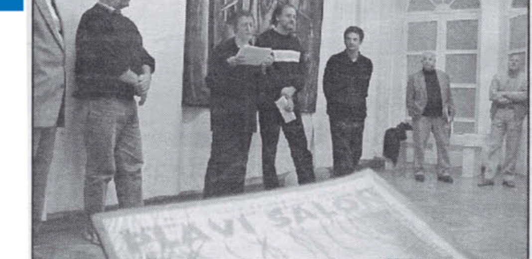
Plavi salon - otvaranje drugog nastavka prestižne likovne priredbe.