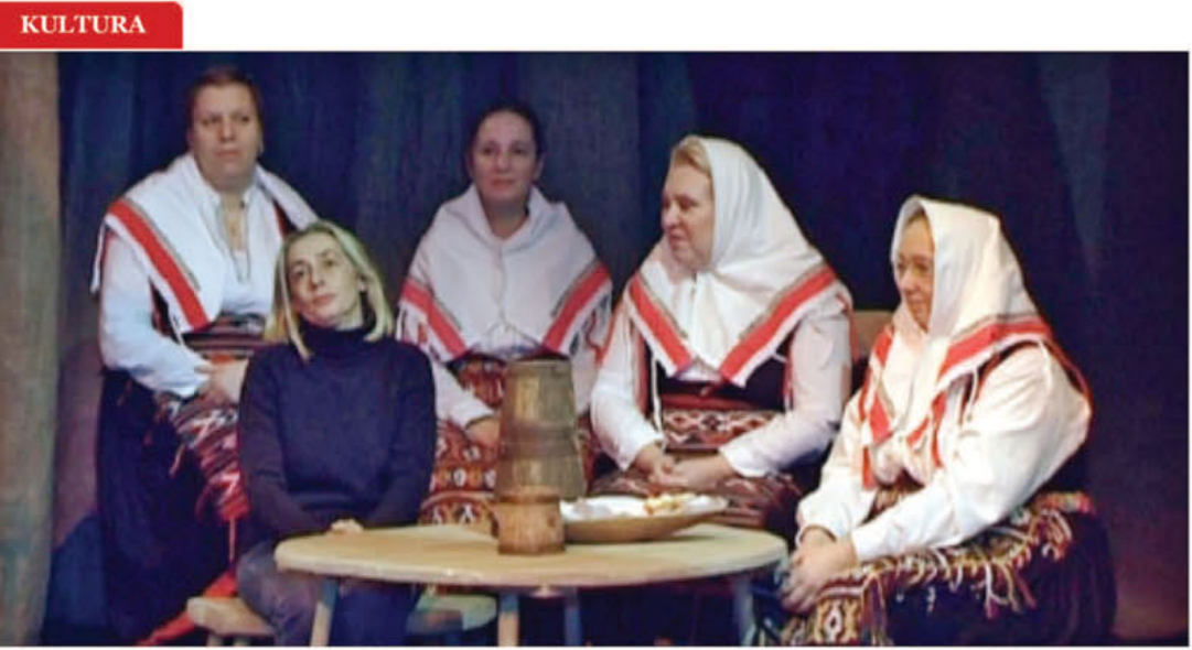
"Na dobro vam došla Badnja večer"

04.12.2015. "Na dobro vam došla Badnja večer" - Televizija VOX Zadar