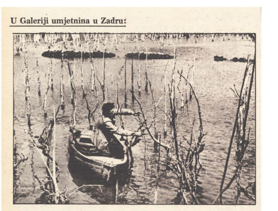
U Galeriji umjetnina u Zadru: Obrezevanje vinograda iz čamca na Velom Jezeru, Zman, Dugi otok.

Odjeli muzeja često su svoje snage udruživali u pripremi zajedničkih interdisciplinarnih izložbi. Jedna od njih je izložba o prisustvu čovjeka na otocima zadarskog arhipelaga od prapovijesti do naših dana.