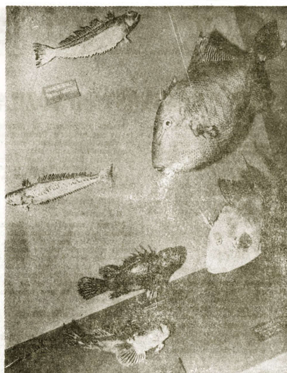
Novo iz Prirodoslovnog odjela Narodnog muzeja u Zadru