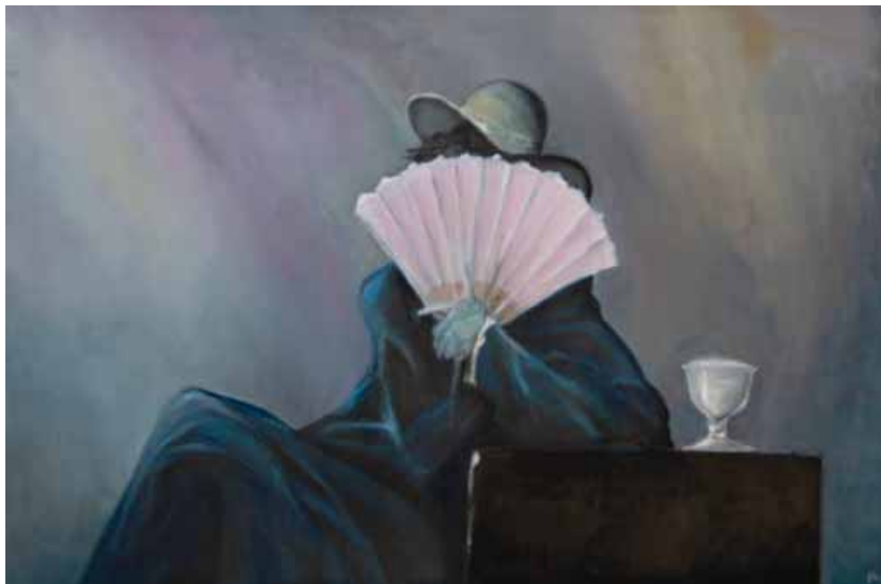
Žena s lepezom, 2023., ulje na platnu, 100x60 cm