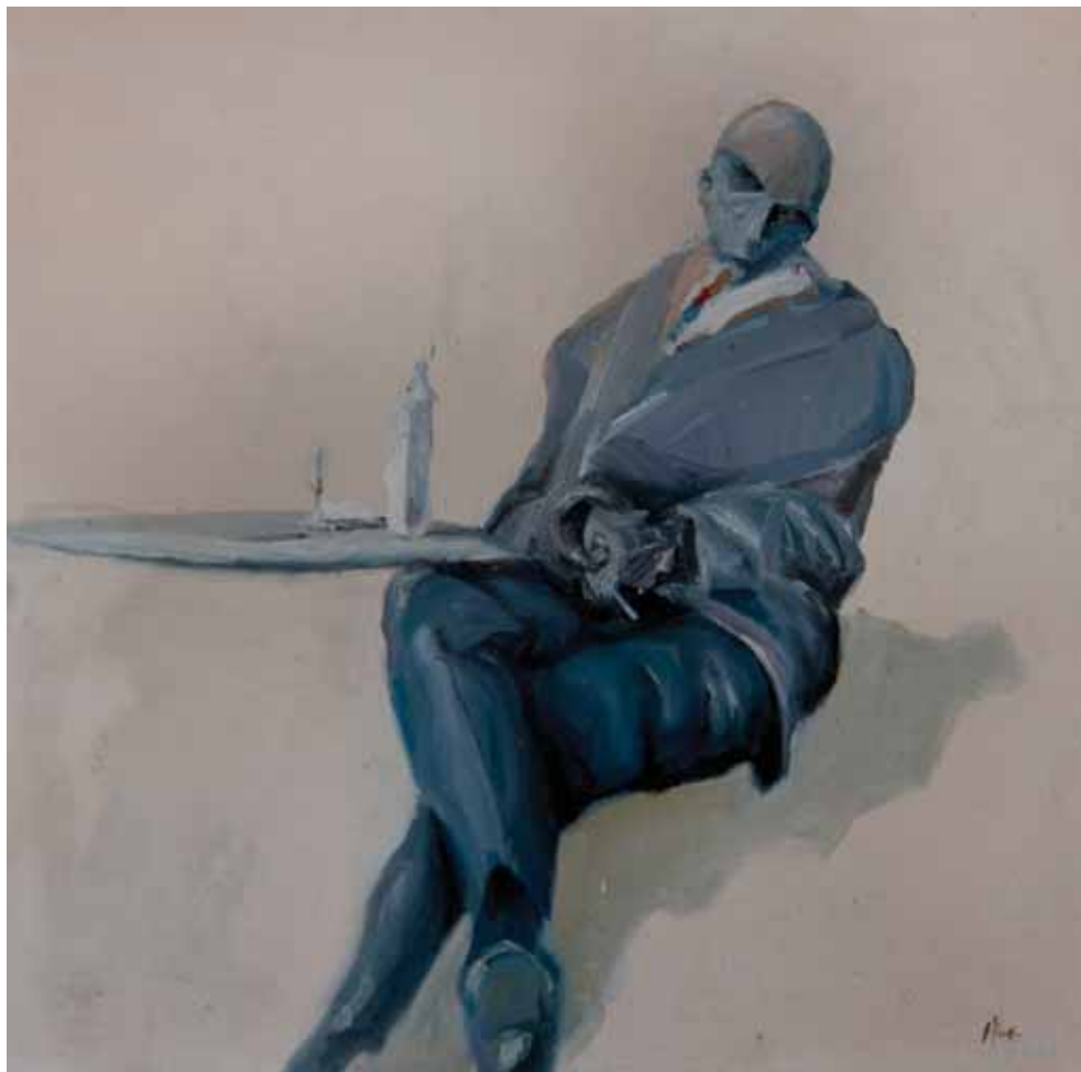
Beskonačno čekanje, 2019., ulje na platnu, 50x50 cm