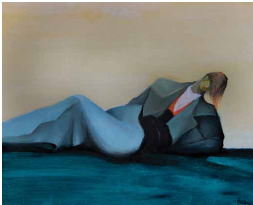
Odmor , 2020., ulje na platnu, 65x54 cm