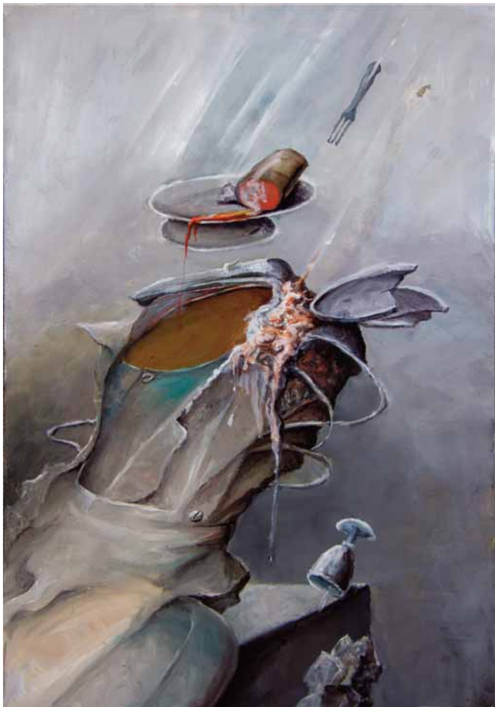
Kraj praznika, 2023., ulje na platnu, 100x60 cm