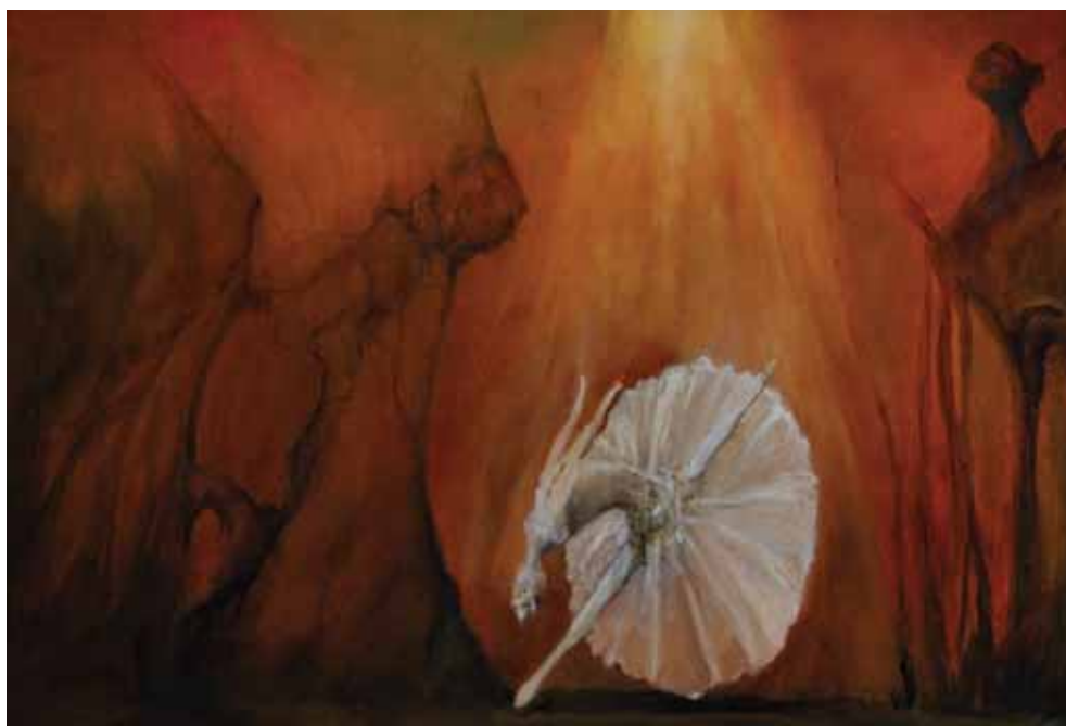
Balet , 2019., ulje na platnu, 100x60 cm