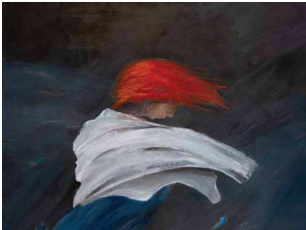
Igra na vjetru , 2023., ulje na platnu, 100x80 cm