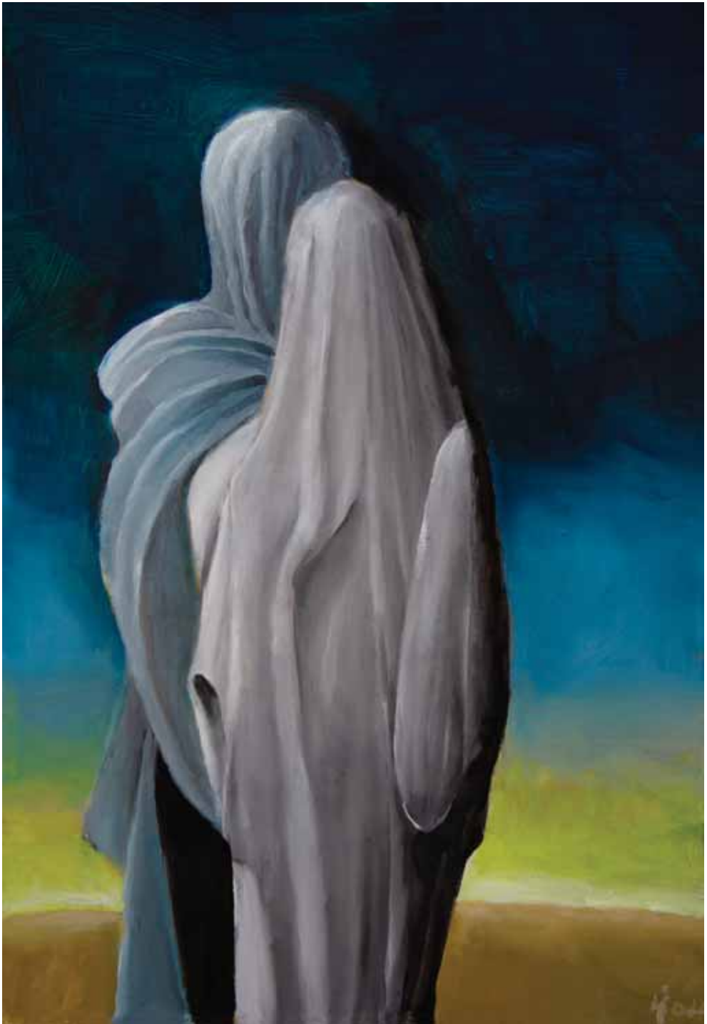
Neidentificirana tijela iz svemira, 2003., ulje na platnu, 88x58 cm