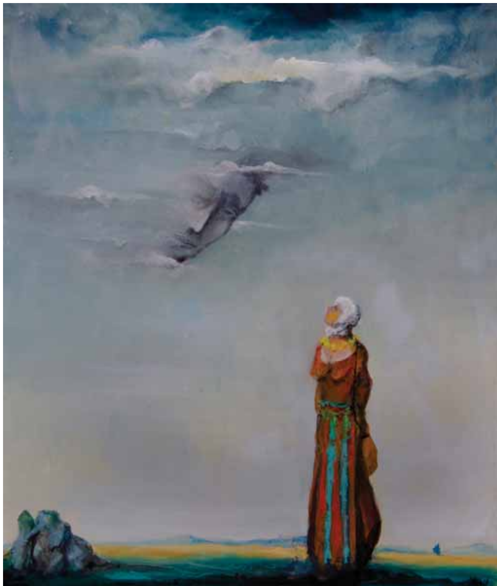
Pojava , 2020., ulje na platnu, 73x60 cm