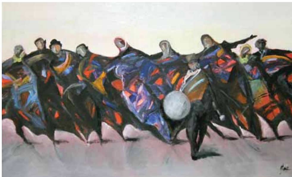
Kolo, 2023., ulje na platnu, 100x60 cm