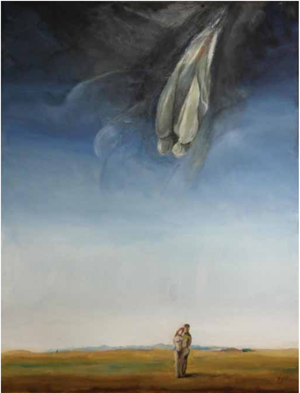
Na zemlji i na nebu, 2023., ulje na platnu, 70x60 cm