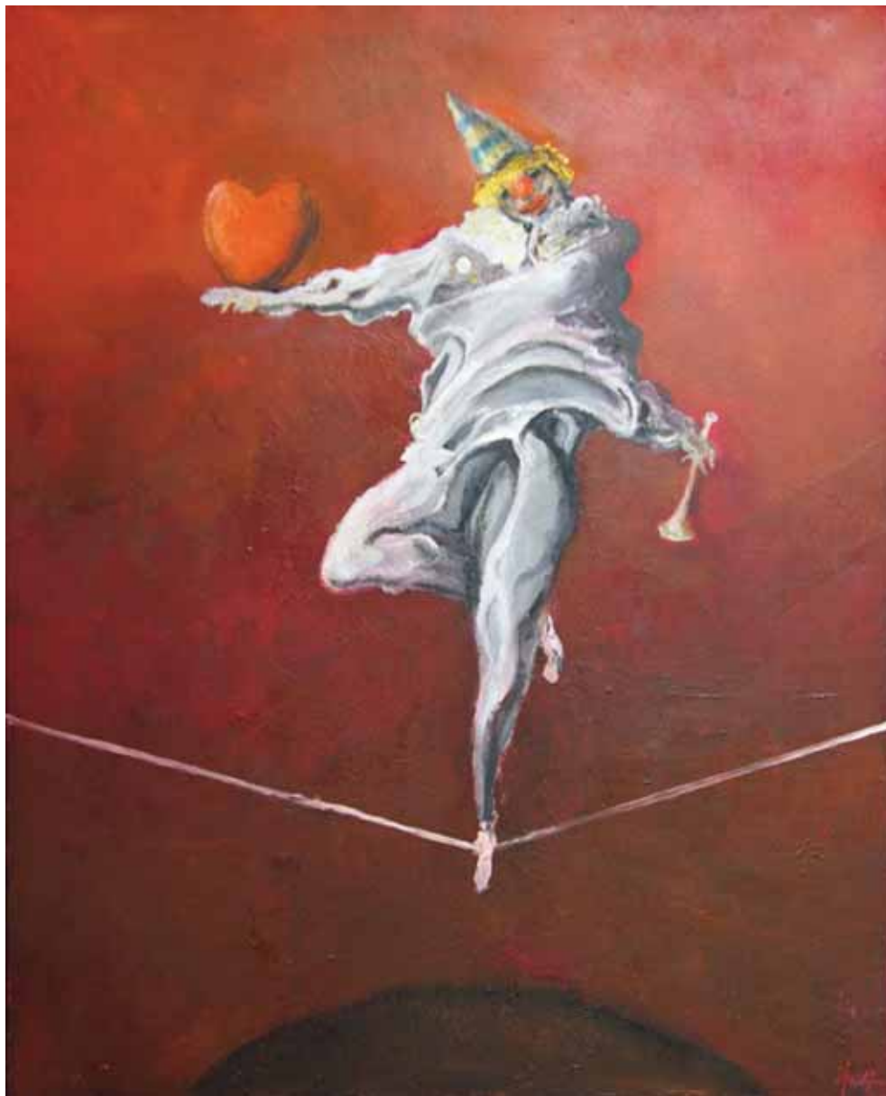
Balans , 2023., ulje na platnu, 54x71 cm