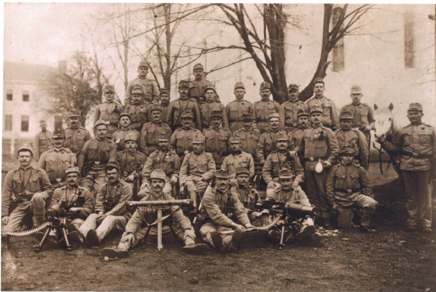
Časnici i dočasnici 22. dalmatinske pješačke pukovnije Lacy u Tuzli 1914. g.

Ova izložba posvećena je vojnicima zadarskog kraja koji su poginuli u tom ratu. Grobovi su im najčešće daleko od rodne Hrvatske za koju su se borili. Njihova počivališta na nekim su bojištima znana, uredno obilježena i uređivana, na drugima znana ali zapuštena, negdje nepoznata.