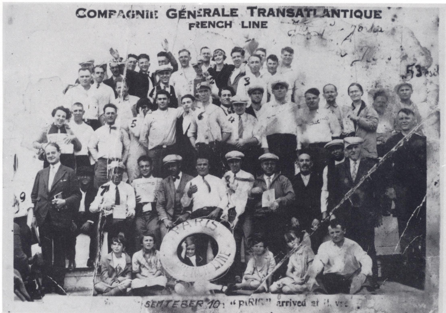
Američki dobrovoljci na putu za SSSR 10. IX 1927.