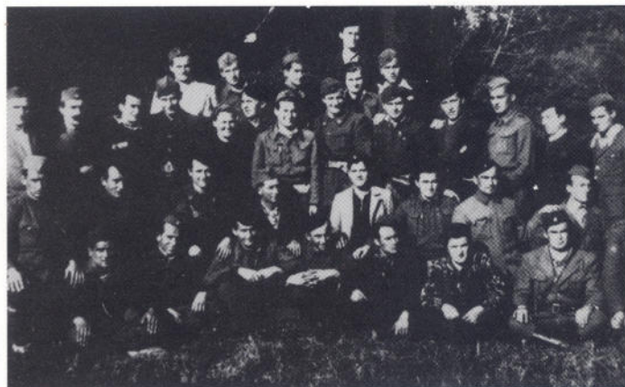
Partijski kurs u Zadru, 1945.

13. Fotografija Huberta Vidakovića, koja se dijelila među radnicima radi prikupljanja pomoći za podizanje spomenika u Zagrebu 1936. godine