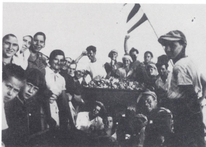
Ugljan, zaselak Guduče, 1939.

društvenog sektora poljoprivrede (PK »Zadar«) te izgradnja novih prometnica.