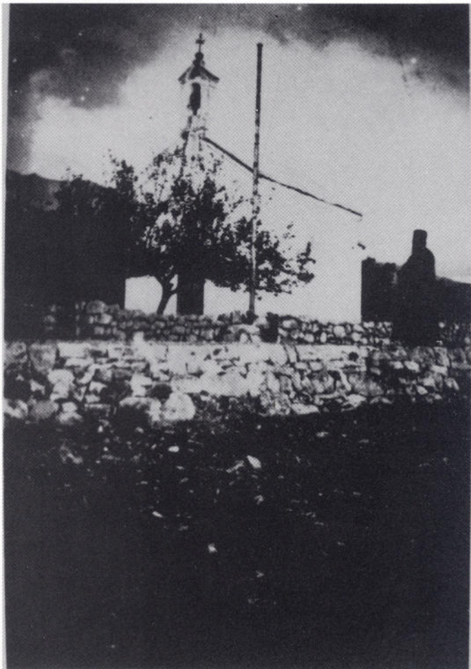
Crkva Sv. M. Arhangela u Tribnju Šibuljini

Ne možemo a da ne kažemo da danas prolazimo kroz izvjesnu ekonomsku a djelomično i društvenu krizu. Savez komunista se suočio s problemom prevladavanja autarkičnosti jugoslavenskog društva. Svjetska ekonomska kriza 70-tih godina i način njenog rješavanja od strane najrazvijenijih zemalja potencirale su i naše