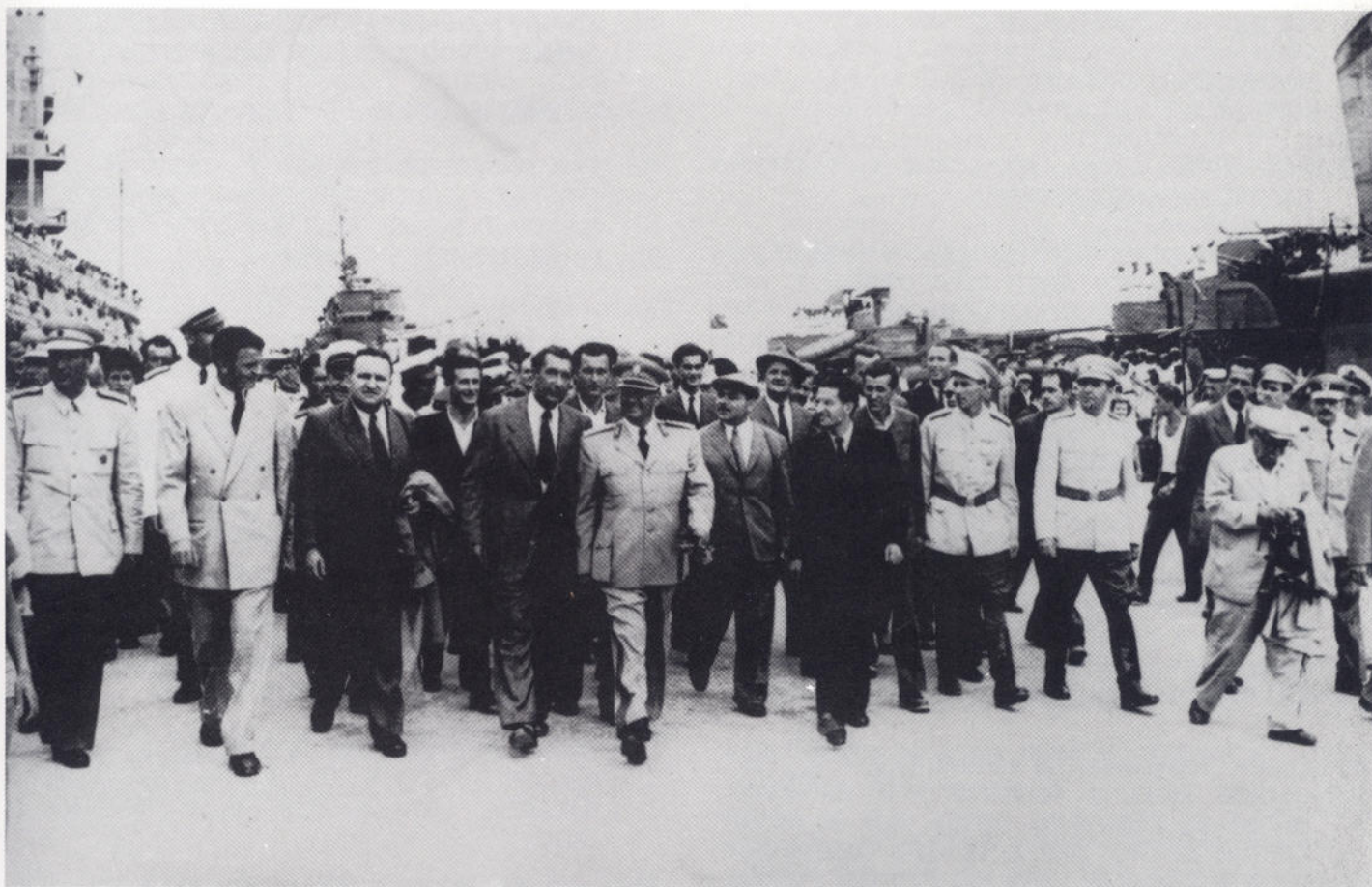
Prvi posjet druga Tita Zadru, 17. VII 1951.