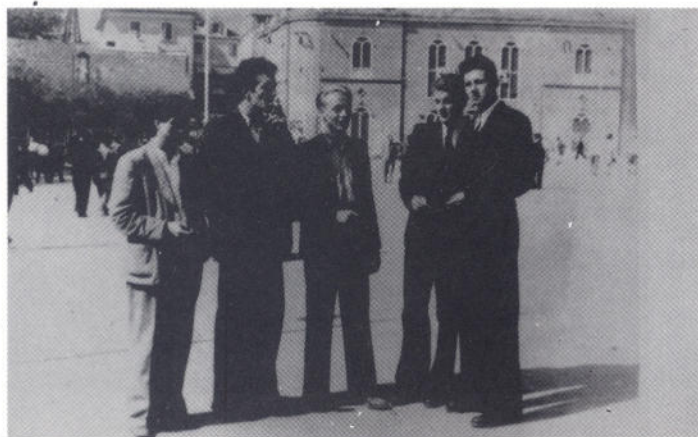
Grupa skojevaca sa zadarskog područja u Šibeniku

1947. godine — Kotarski komitet Zadar je imao 899 članova