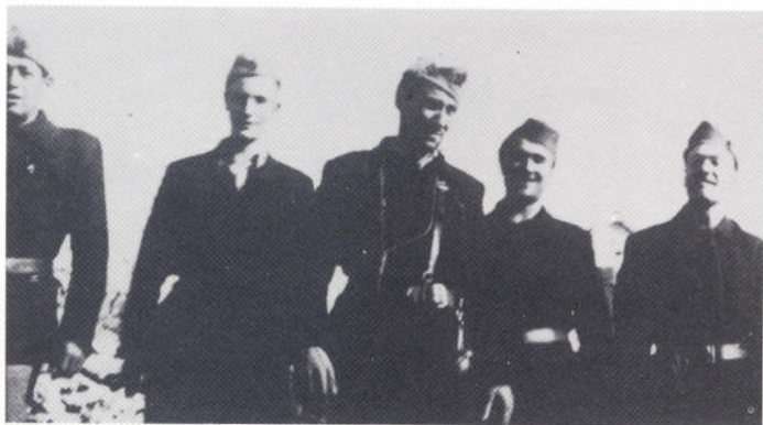
Članovi Okružnog komiteta KPH za sjevernu Dalmaciju, 1942.