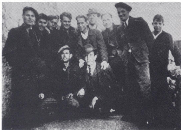
Grupa Veložšana, 1940.