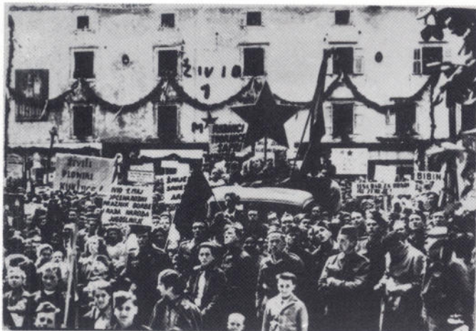
Prvomajska proslava u Zadru, 1945.