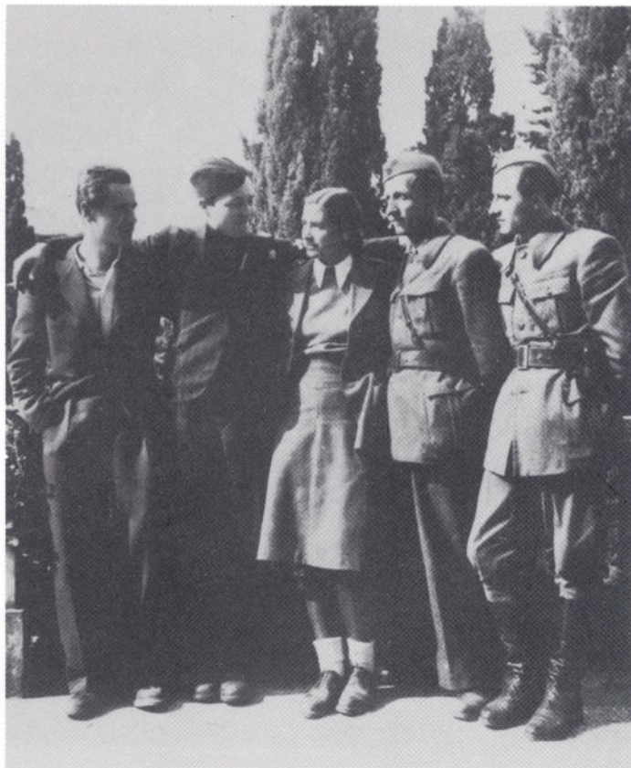
Članovi Okružnog komiteta KPH Zadar, 1945.