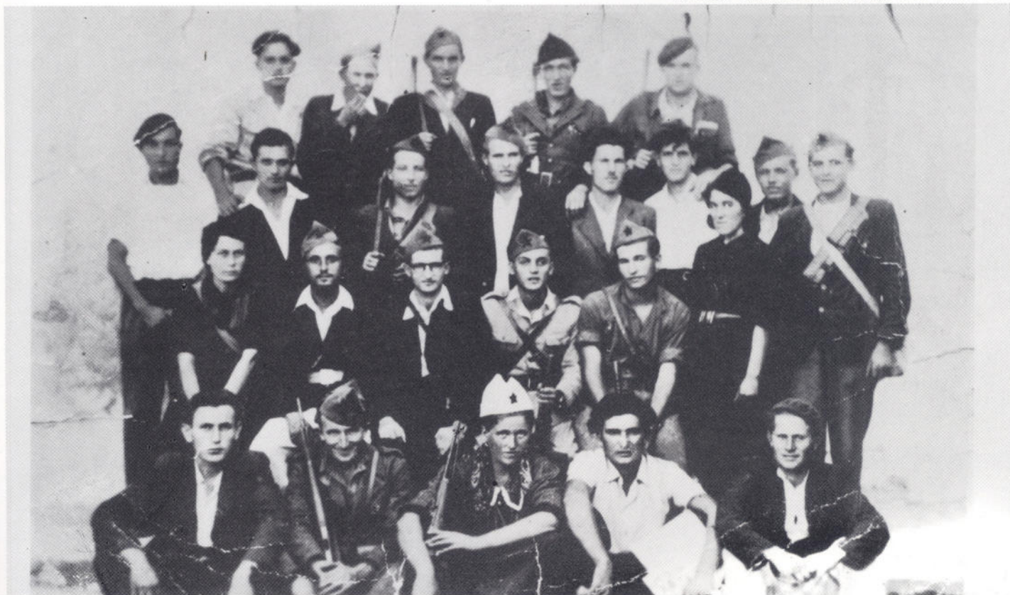
Delegati Općinske konferencije SKOJ-a Nin, 1943.