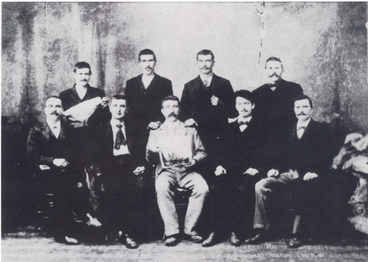
Zadarski socijalisti, 1902.

bilo je 300 članova. To je bila osnova da Partija u narodu jača i širi svoj utjecaj, tako da je već prvih dana ustanka, slijedeći poziv KPJ na općenarodni ustanak, na zadarskom području bilo pripravno za odlazak u partizane 500 boraca. Taj podatak najbolje pokazuje koliko su i kako komunisti politički djelovali i kakav su imali utjecaj u narodu.