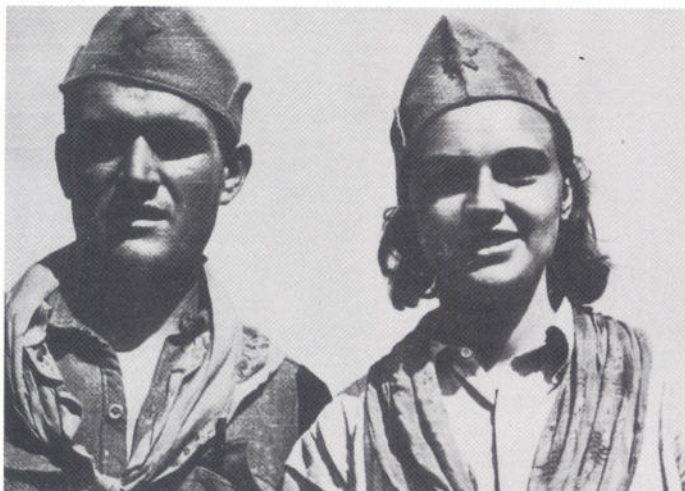
Članovi Okružnog komiteta SKOJ-a za sjevernu Dalmaciju, 1942.