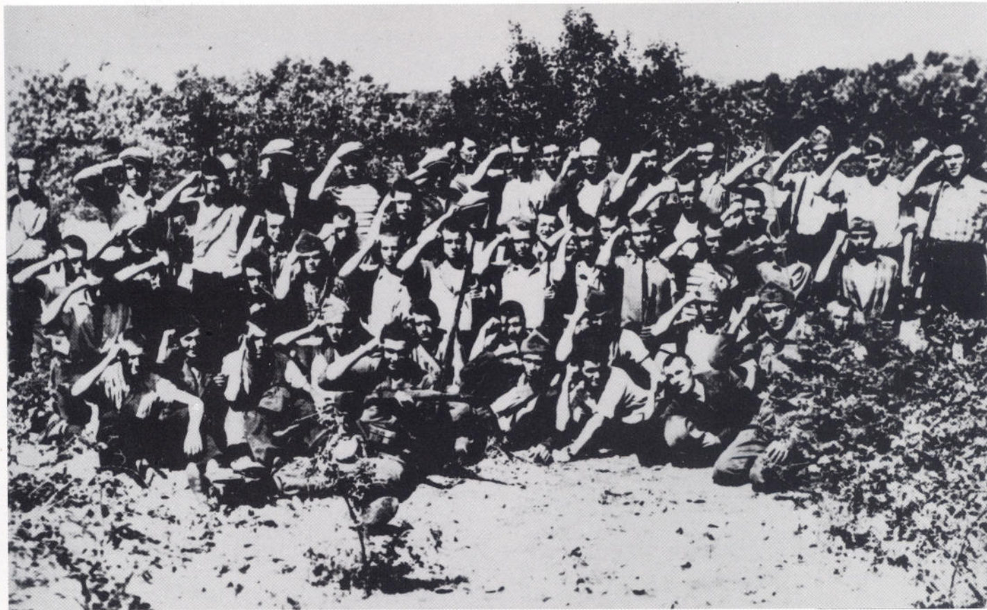
Maloiški ustanici, 1942.