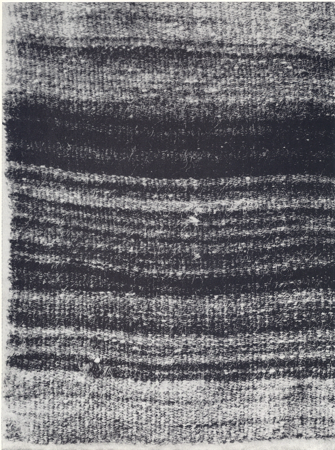
Sl. 3. — VREĆA, Bilišane, kat. br. 21.