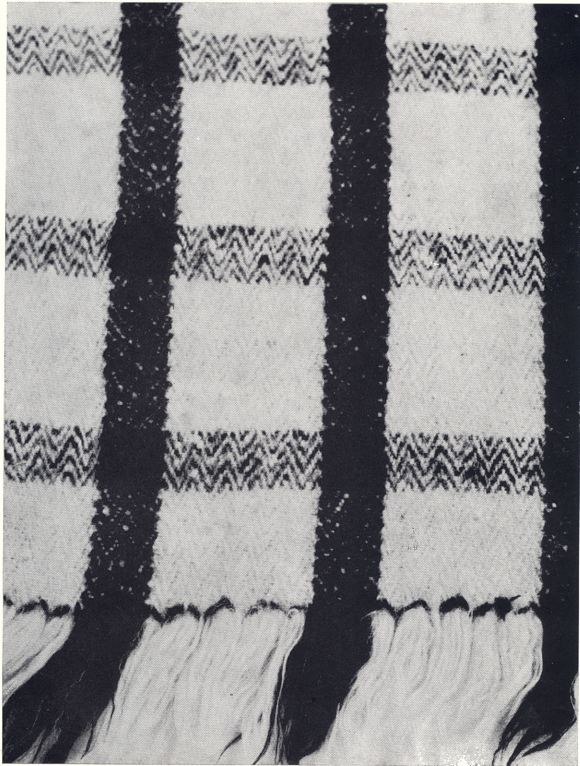
Sl. 2. — SUKANCE, Starigrad, kat. br. 11.