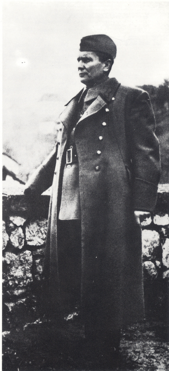
Josip Broz Tito, vrhovni komandant NOV i POJ