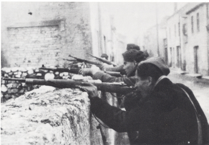
Ulične borbe u Mostaru