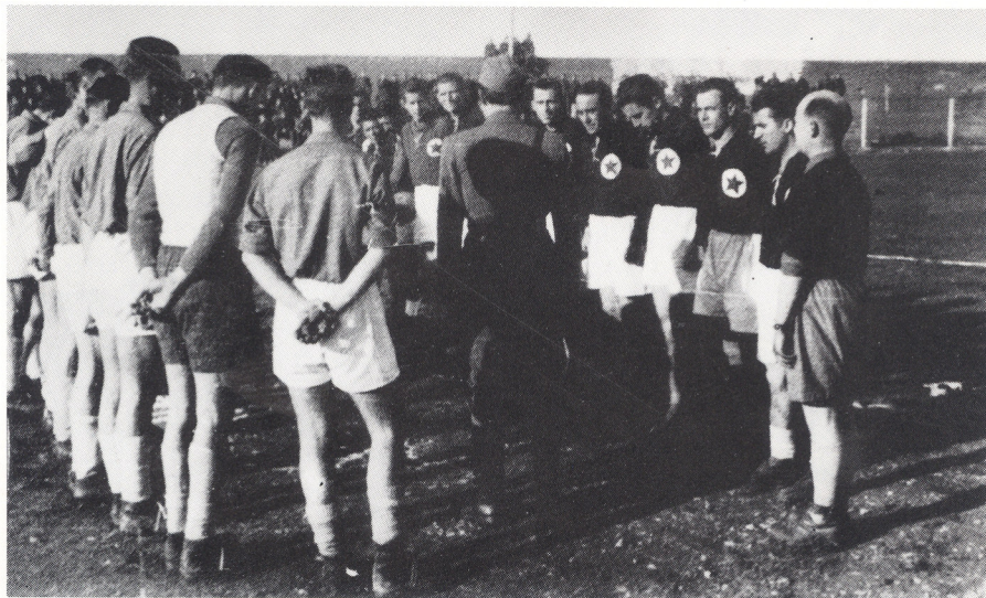
Nogometna utakmica u oslobođenom Zadru