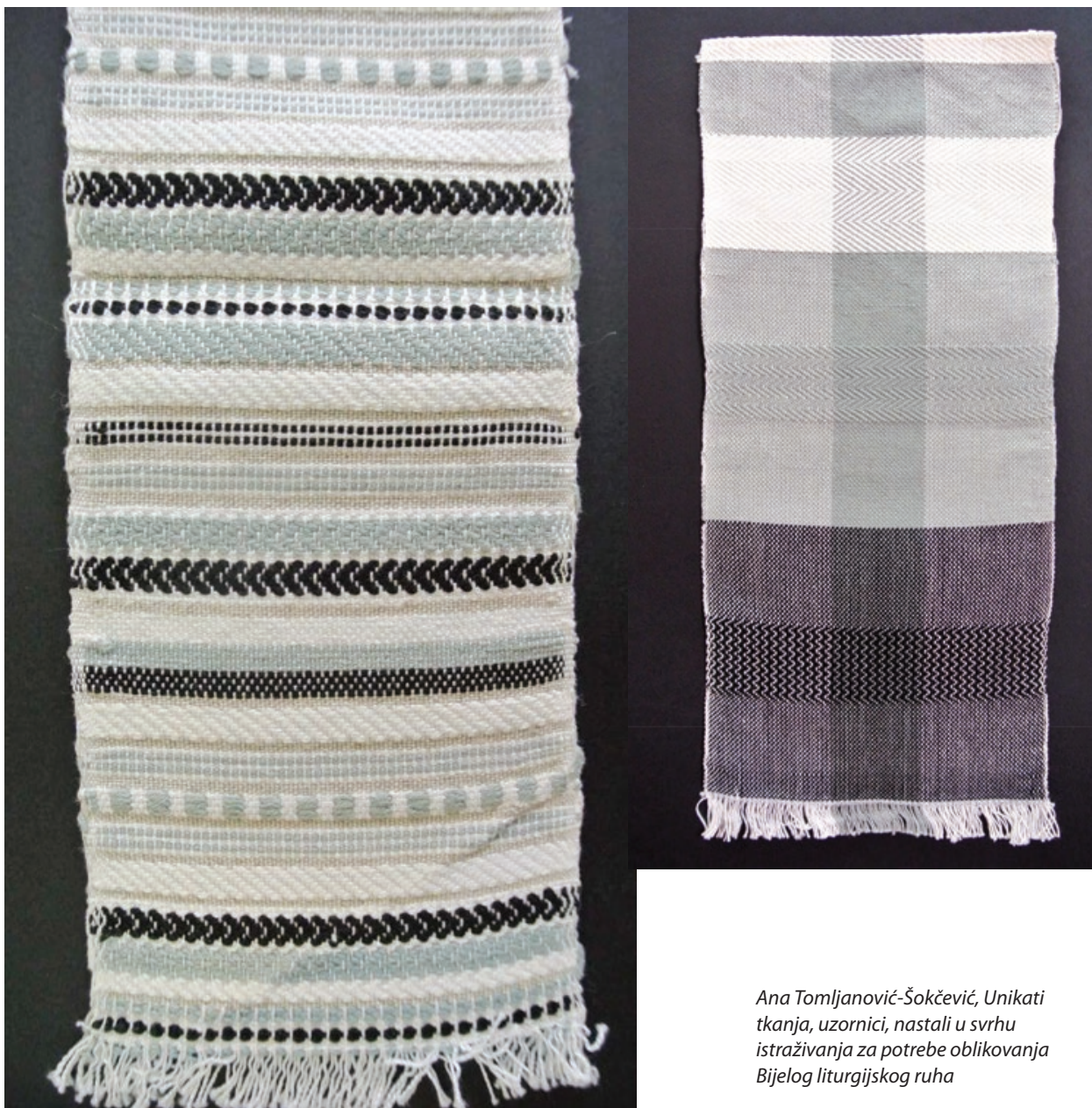
Ana Tomljanović-Šokčević, Unikati tkanja, uzornici, nastali u svrhu istraživanja za potrebe oblikovanja Bijelog liturgijskog ruha