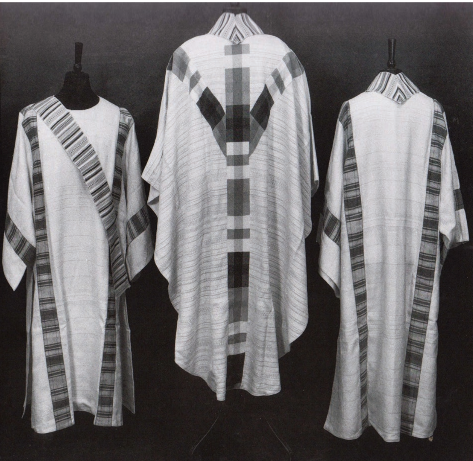
Ana Tomljanović-Šokčević, Liturgijsko ruho, Bijeli komplet, 1965., Vlasništvo: Zadarska nadbiskupija