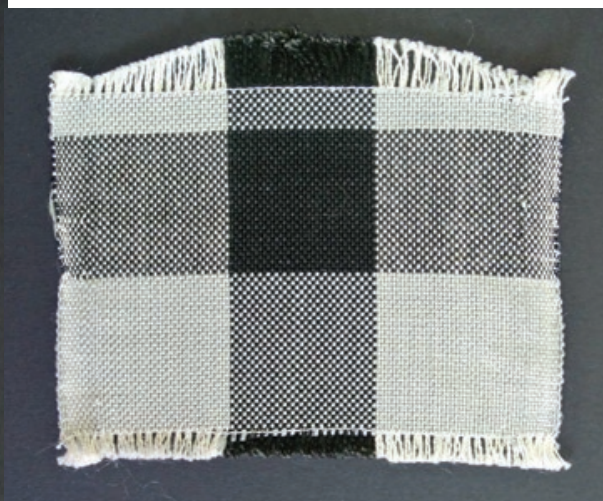
Ana Tomljanović-Šokčević, Unikati tkanja, uzornici, nastali u svrhu istraživanja za potrebe oblikovanja Bijelog liturgijskog ruha