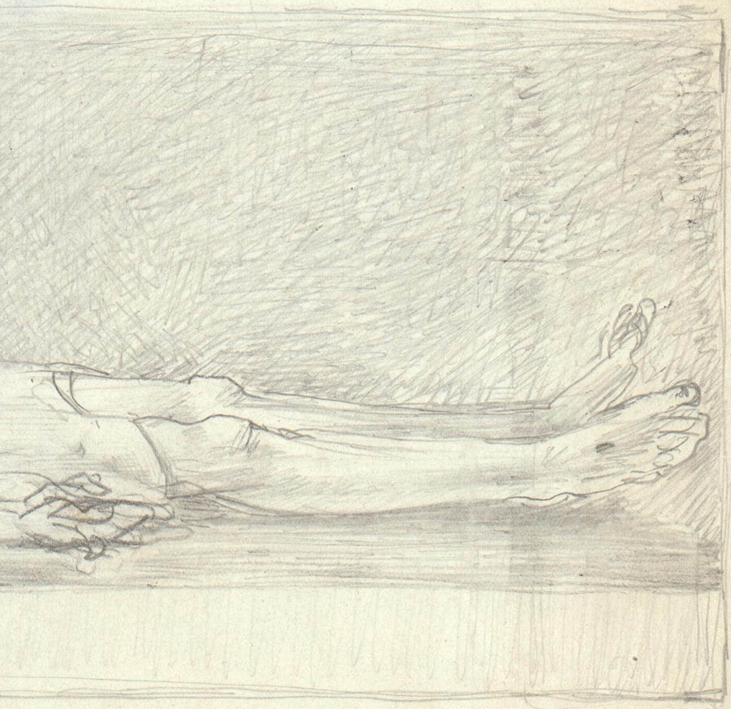
Jozo Kljaković, Jozo Kljaković, olovka na papiru, 13,3x35,4 cm, Vlasništvo: Grad Zagreb