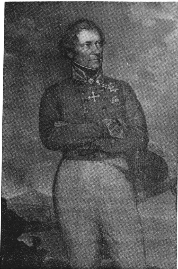
Vetter von Lilienberg

Narodni muzej u Zadru danas čini opća muzejska organizacija sa svojih pet odjela: Etnografskim odjelom, Prirodoslovnim odjelom, Kulturno-historijskim odjelom, Galerijom umjetnina i Odjelom revolucije. Osnovna mu je djelatnost muzejska