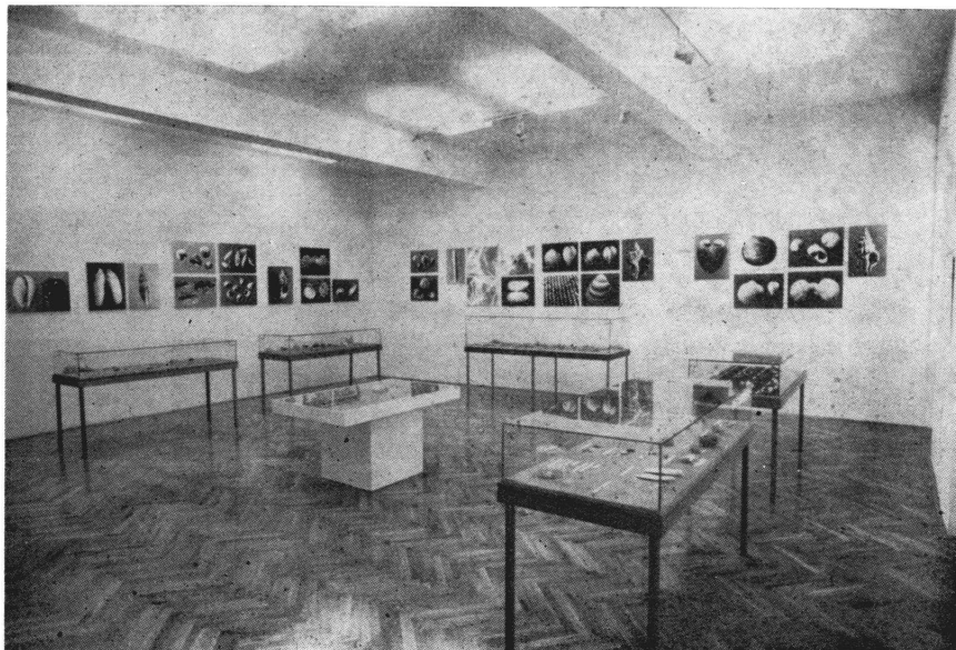
Prirodoslovni odjel, Školjkaši i puževi Jadrana

skoj djelatnosti, došlo se do spoznaje još u prošlom stoljeću, kada su u svijetu ustaljeni principi za suvremenu muzejsku arhitekturu. Utvrđeno je da muzej, pored višenamjenskih izložbenih prostorija, ima prostorije za depoe, studijske zbirke, preparatorske i restauratorske radionice, fotolaboratorij, za muzejsku dokumentaciju, biblioteku, za stručno osoblje i razne pomoćne i tehničke službe.