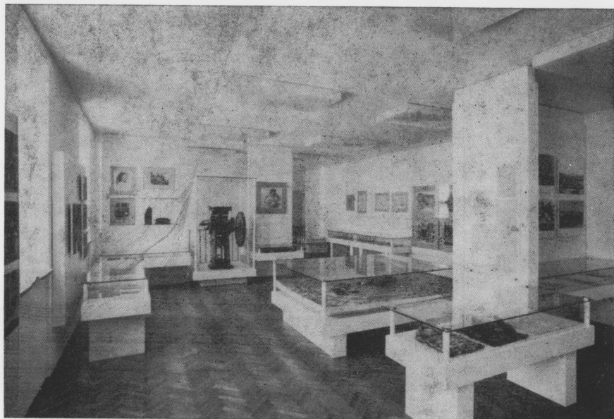
Odjel revolucije, stalni postav

Za godinu početka organiziranog djelovanja zadrarskih muzeja uzima se 1832, kada je namjesnik dalmatinski Vetter von Lilienberg izdao i potpisao proglas kojim su pozvana sva nadleštva i cjelokupno stanovništvo u zemlji da svaki prema svojim mogućnostima pomogne osnivanje Narodnog muzeja u Zadru. Taj je muzej, prema zamisli, trebao obuhvaćati uzroke iz prirodnih nauka, starina i narodne i industrijske djelatnosti. Tada je dakle osnovan opći muzej (kompleksni) koji je obuhvatio sve djelatnosti kojima se danas bave Arheološki i Narodni muzej u Zadru. Prije osnivanja Narodnog muzeja, u Zadru postoji više privatnih zbirki i galerija. Iz tog muzeja razvili su se kasnije — 80-tih godina prošloga stoljeća Arheološki muzej i Prirodoslovni muzej 30. XII 1907. godine (osnivačka skupština). Po oslobođenju Zadra, u rujnu 1945. osnovan je ponovo Narodni