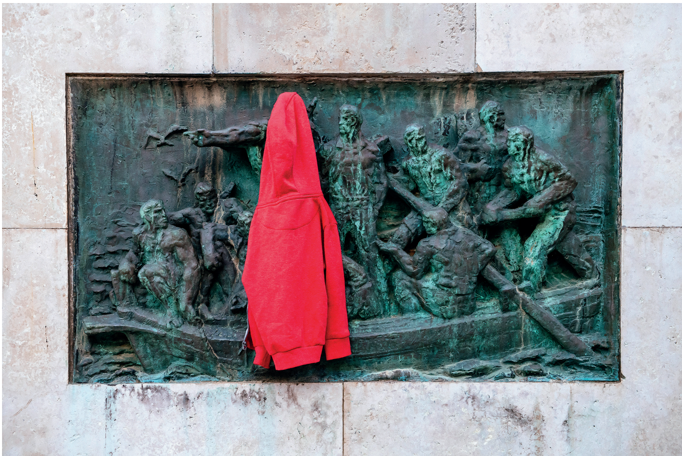
Ludi Hudi / Knež 2017

Statistikama usprkos, u prilog izreci malo nas je, al' nas ima ide i fotografija maškara kao potvrda uvijek spremnih otočana na zabavu i u zimskim danima kada