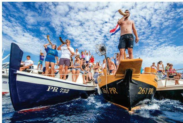
Huk / Tražet 2015