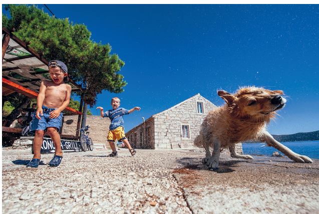
Tuš / Komoševa 2010