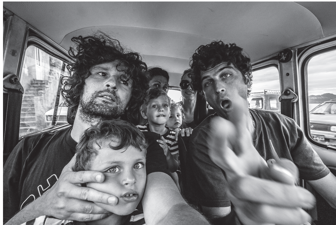
Mali div / Komoševa 2010