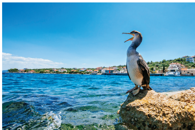
Geronimo / Komoševa 2017