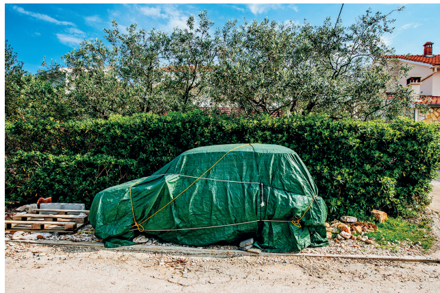
Izolacija / Komoševa 2013