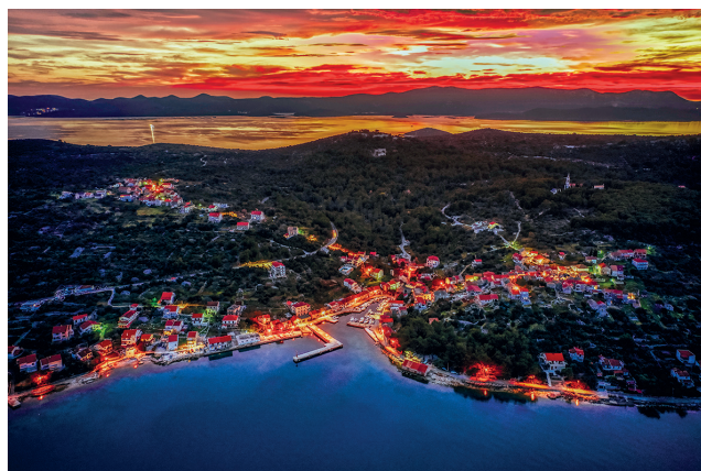
Dobra večer / Mali Iž 2020