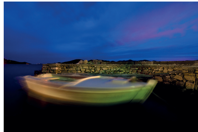
Nestajanje / Malinina 2013

otok opusti, a o duhovitosti Ižana kao i o Stipinom brzom refleksu i oštroj oku koji od obične situacije u tren stvore nadrealnu sliku govore Tunman , U potrazi za Elzom i Vratija se Šime . Otočka ljeta puna vreve, susreta ljudi i bezbrižnih dječjih igara ogledaju se u nizu dinamičnih fotografija ( Pobjeda, Tuš, Ljudi i brodi, Huk, Ispod sela, Operacija jež, Kralji ). Jednako kao što otočani znaju feštati, nenadmašni su i u svom otočkom zenu, kada se povuku u intimu svojih konoba i tinela ( Lopižanje, Vičera ) ili kad najbolju utjehu pruža pogled na pučinu s hunestre . Uz takav prizor, globalni potresi nemaju šansu.