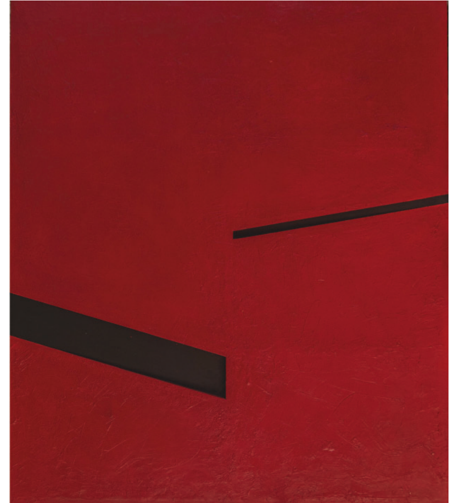
Crveno i crno, 2024. kombinirana tehnika, 130x150cm