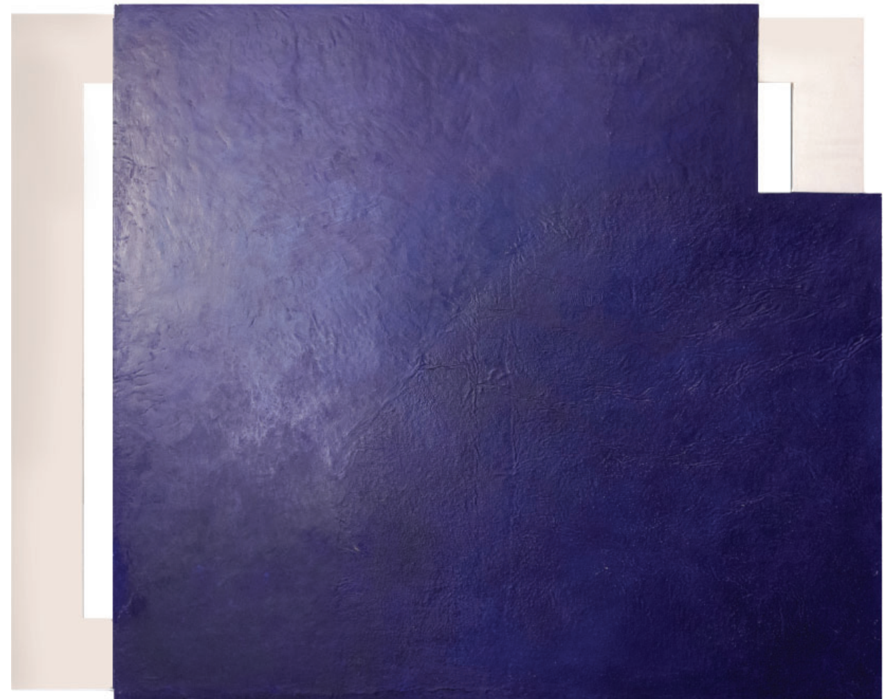
Inkorporacija, 2024. kombinirana tehnika, 170x150cm