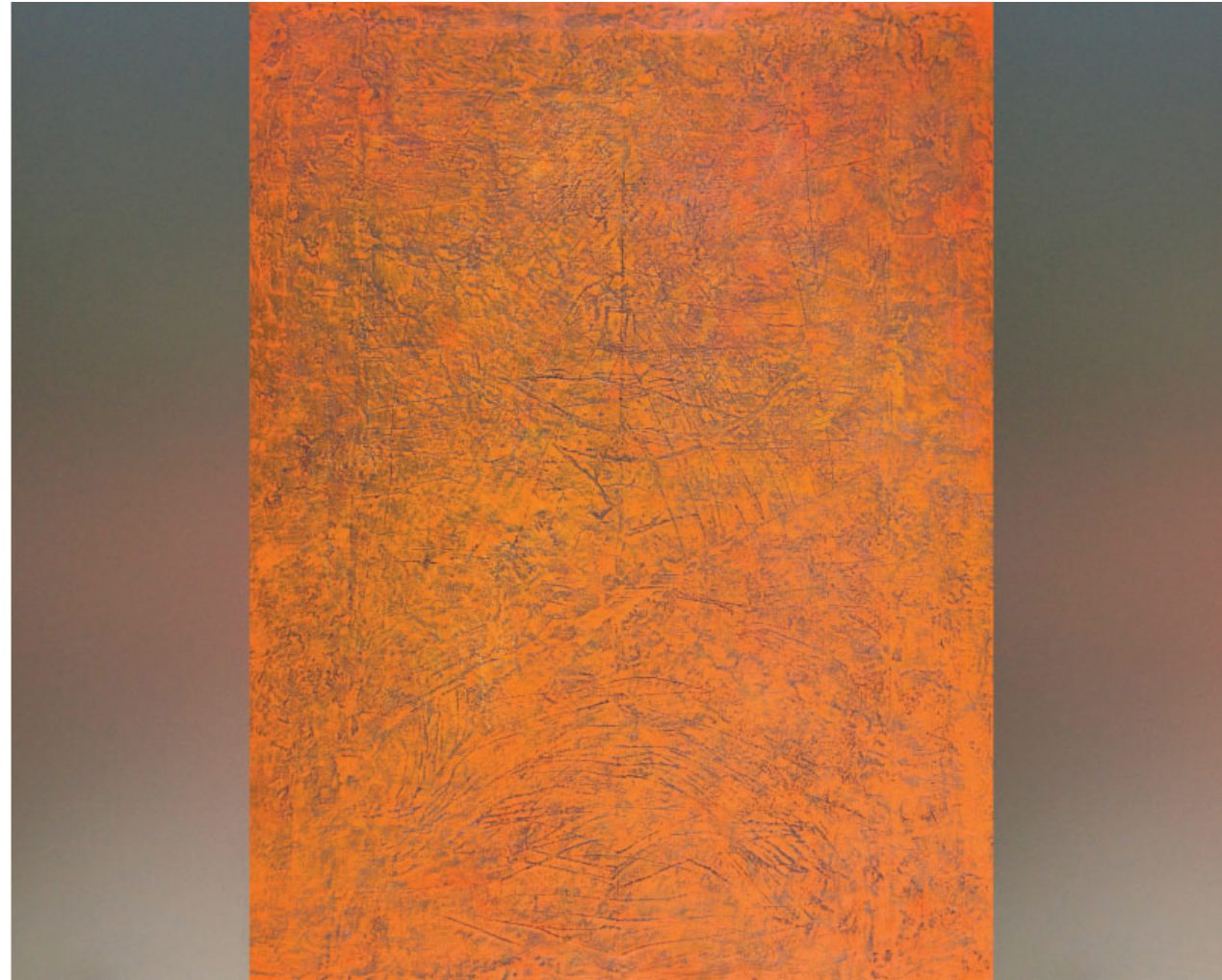
Bez naziva, 2023. kombinirana tehnika, 196x150 cm