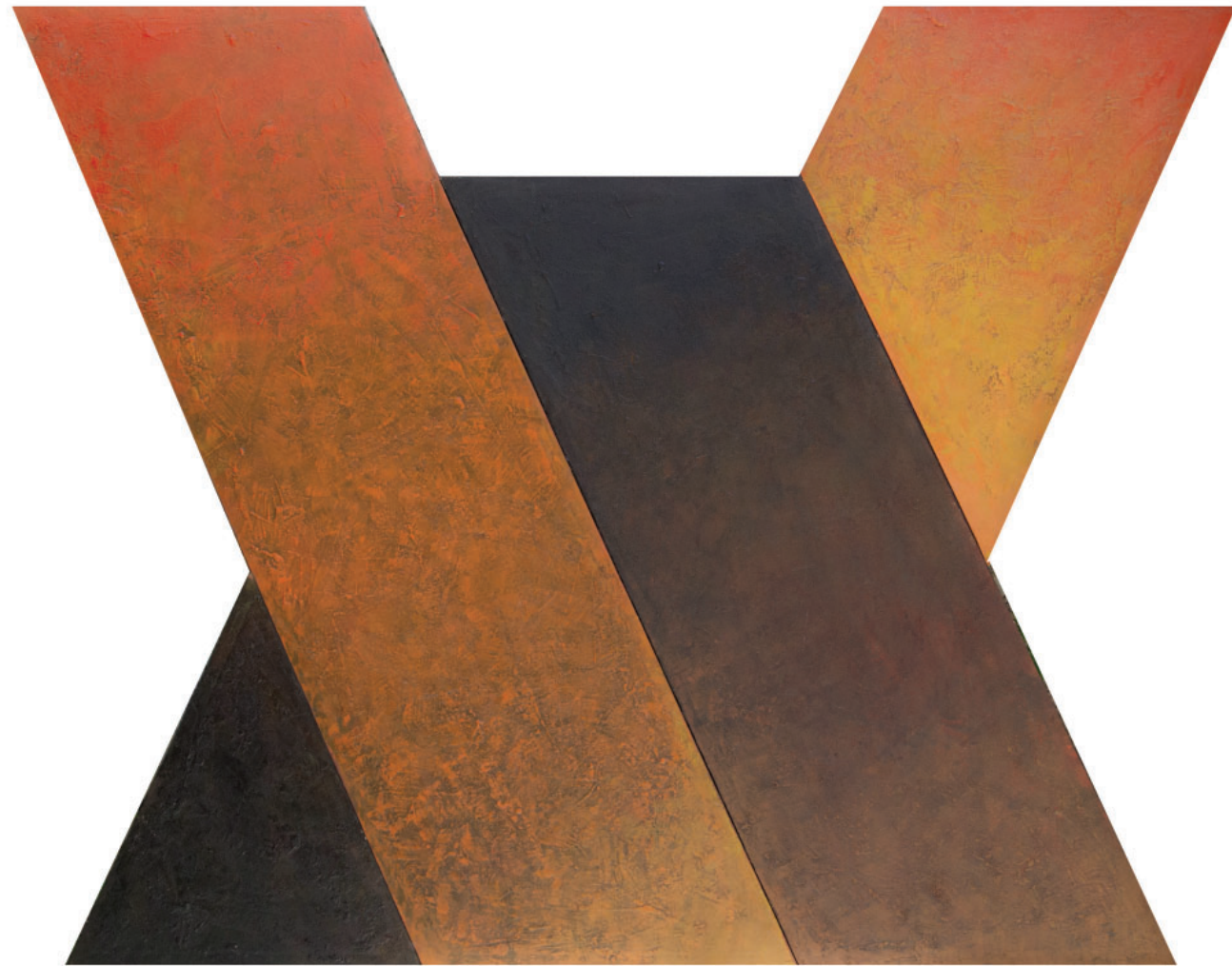
Komplementarno, 2024. kombinirana tehnika, 190x150cm