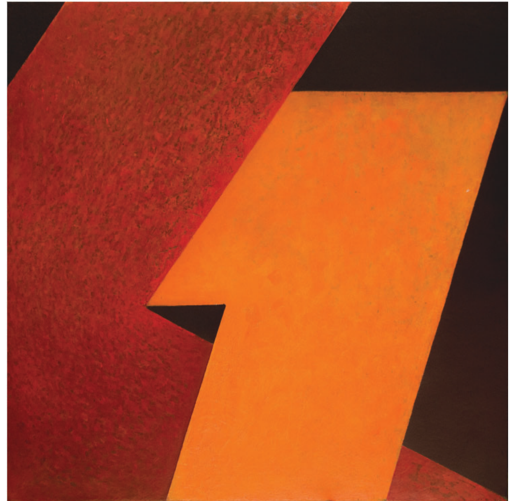
Disparitetno II , 2024. kombinirana tehnika 150x150 cm