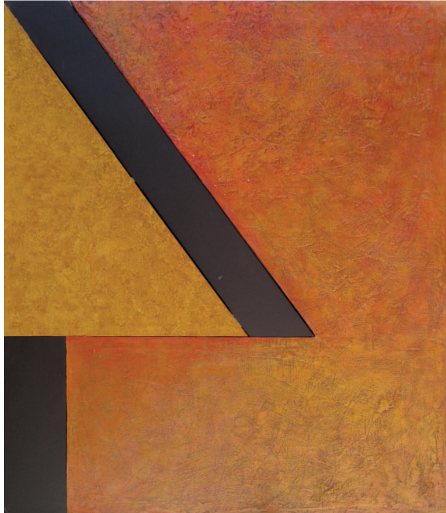
Veliki rascjep, 2024. kombinirana tehnika, 130x150cm