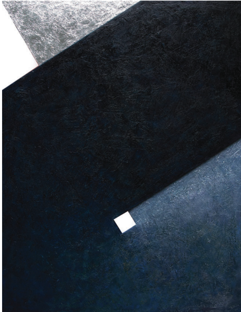
Bez naziva II (iz ciklusa Metamorfoze) 2024. kombinirana tehnika, 120x150 cm